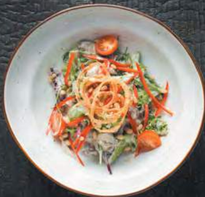
ТЕПЛЫЙ САЛАТ С КОПЧЕНЫМИ КОЛБАСКАМИ И КАРТОФЕЛЕМ АЙДАХО

С вешенками, луком фри, томатами черри и кедровыми орешками