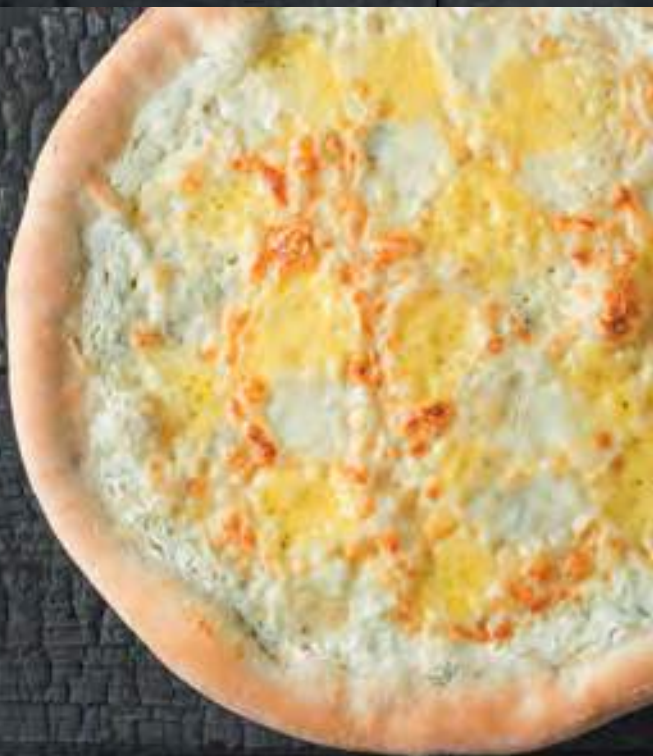
ЧЕТЫРЕ СЫРА 450