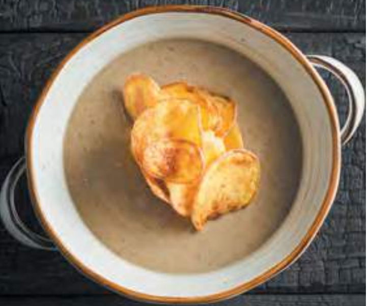
ГРИБНОЙ КРЕМ-СУП 250