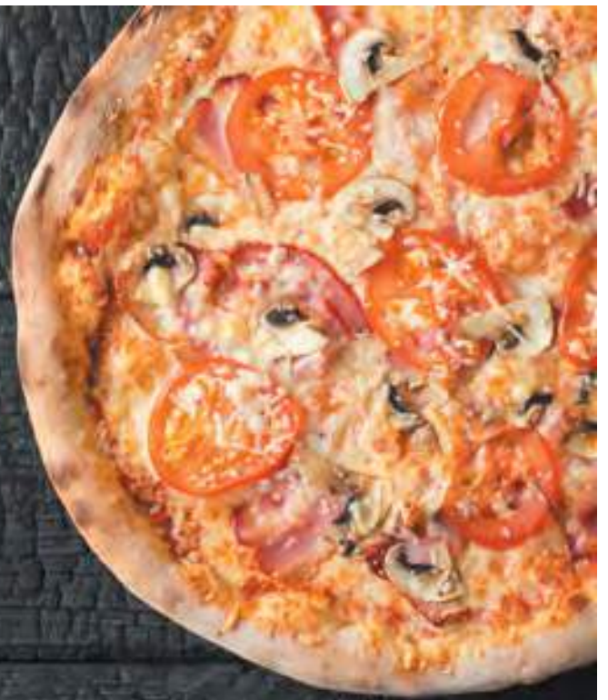
С ВЕТЧИНОЙ И ГРИБАМИ 420