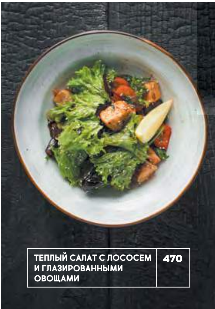
ТЕПЛЫЙ САЛАТ С ЛОСОСЕМ И ГЛАЗИРОВАННЫМИ ОВОЩАМИ 470