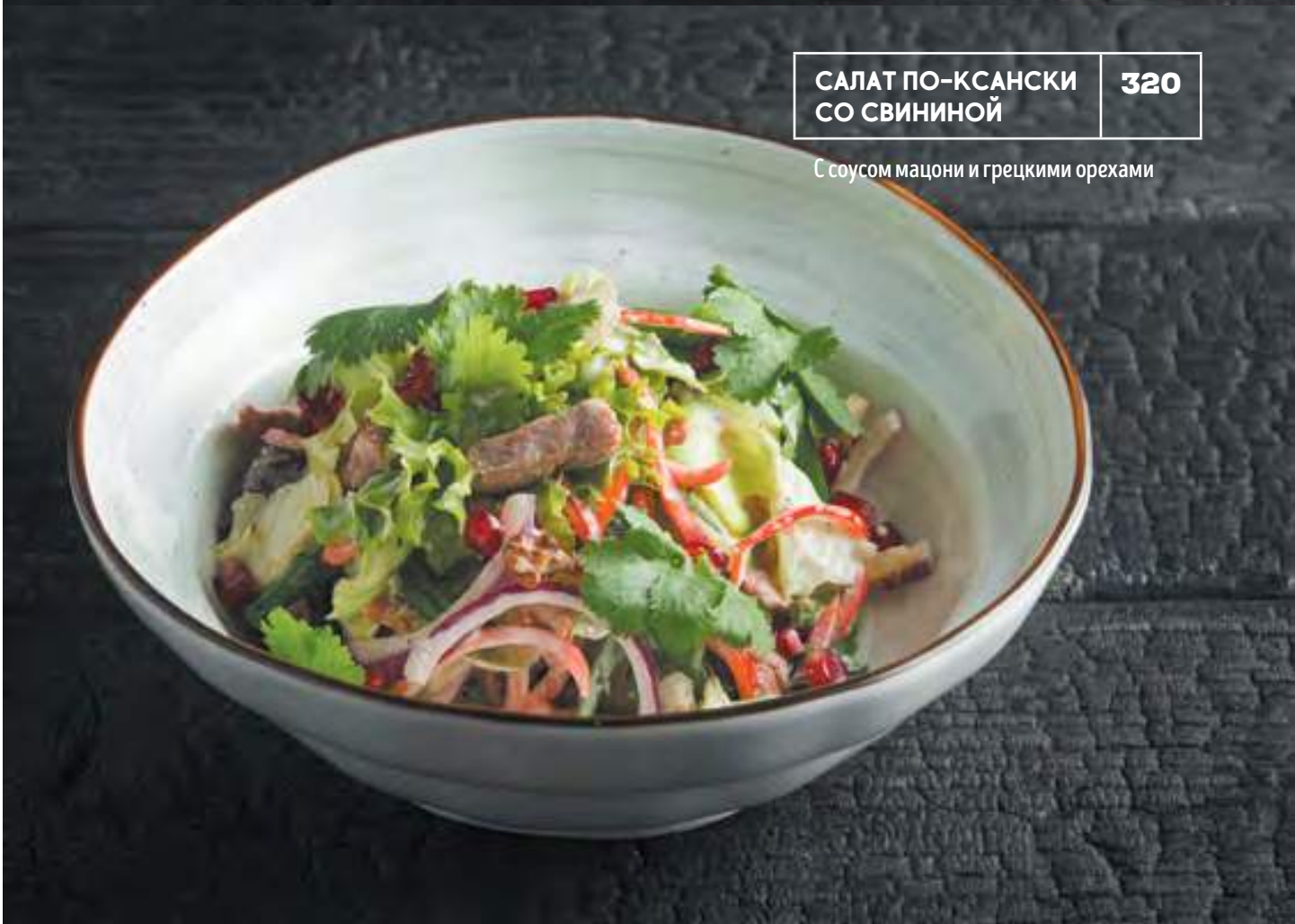
САЛАТ ПО-КСАНСКИ СО СВИНИНОЙ 320