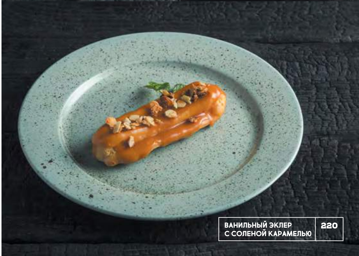
ВАНИЛЬНЫЙ ЭКЛЕР С СОЛЕНОЙ КАРАМЕЛЬЮ 220