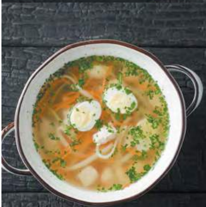
КУРИНЫЙ БУЛЬОН С ЛАПШОЙ 250