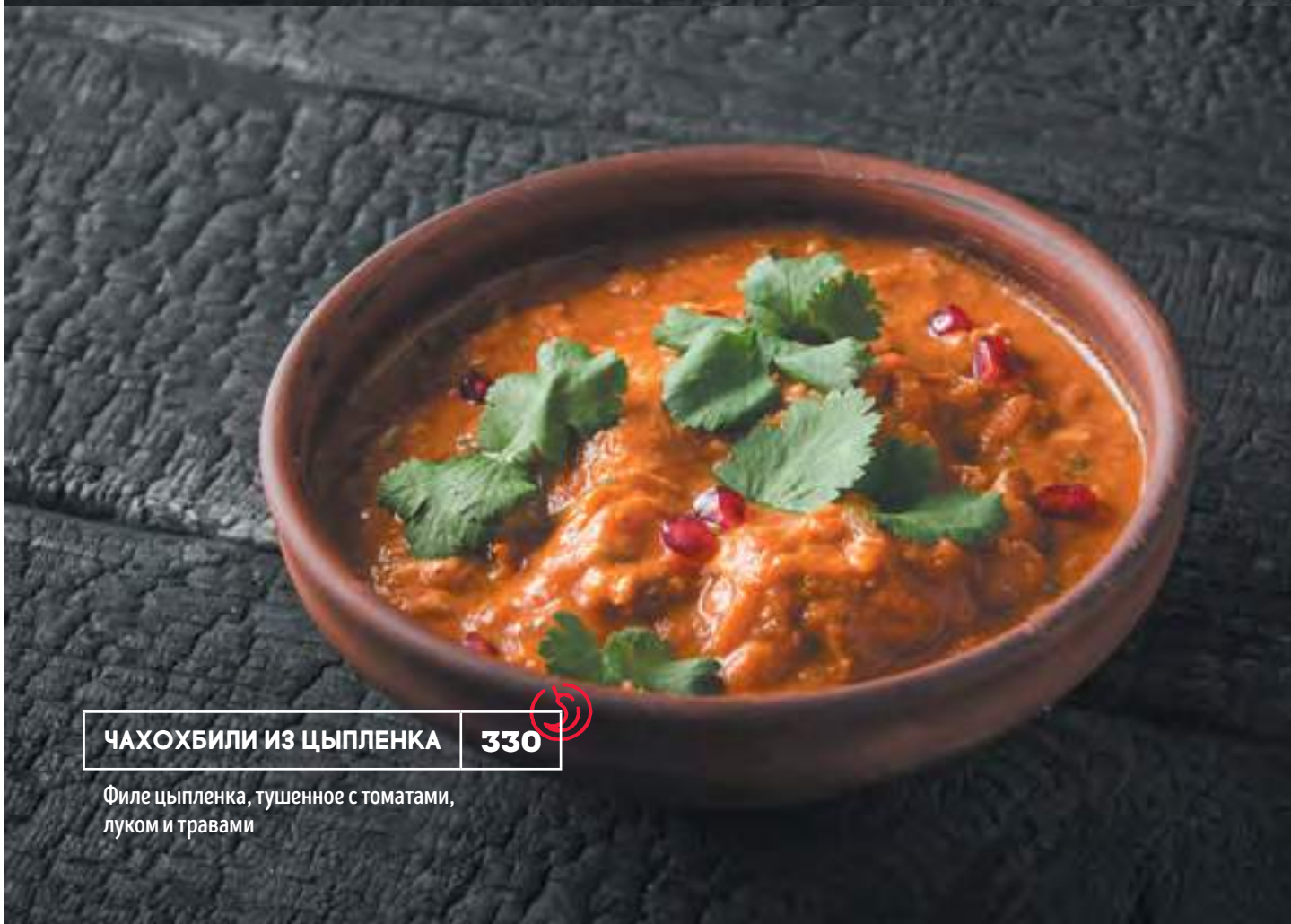
ЧАХОХБИЛИ ИЗ ЦЫПЛЕНКА