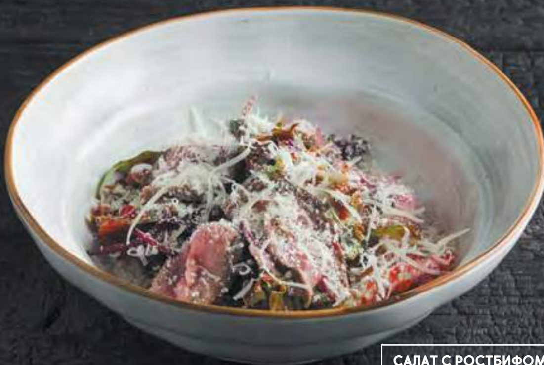
САЛАТ С РОСТБИФОМ, ГРУШЕВЫМ КОНФИТЮРОМ И ПАРМЕЗАНОМ