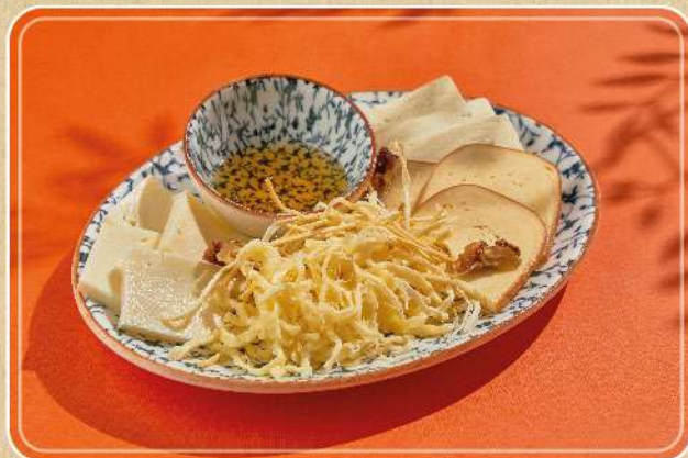
АССОРТИ ДОМАШНИХ СЫРОВ