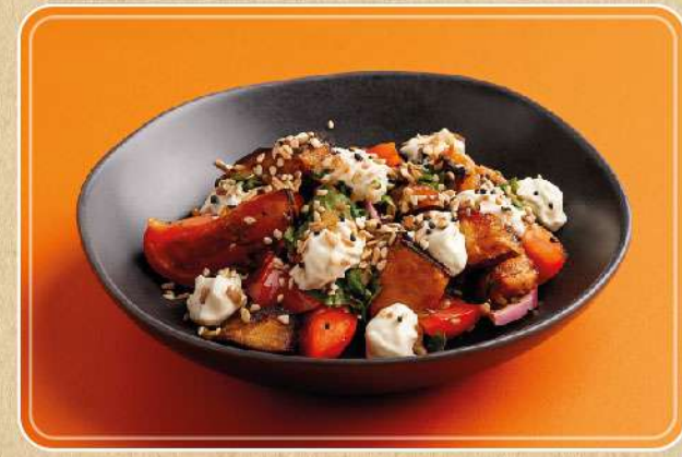
САЛАТ С ХРУСТЯЩИМИ БАКЛАЖАНАМИ