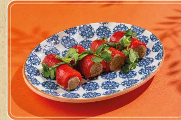
ПЕРЕЦ С ОРЕХАМИ ПО-ГРУЗИНСКИ