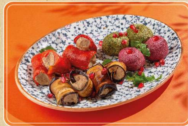
АССОРТИ ГРУЗИНСКИХ ЗАКУСОК