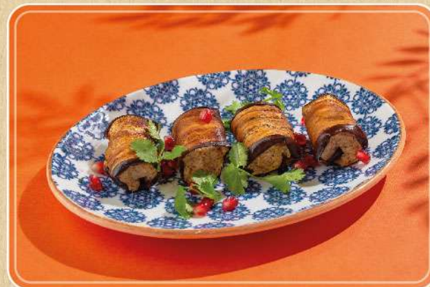
БАКЛАЖАНЫ С ОРЕХАМИ ПО-ГРУЗИНСКИ