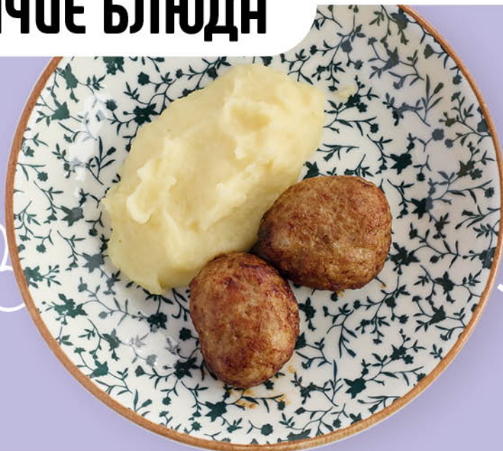
КУРИНЫЕ КОТЛЕТЫ С КАРТОФЕЛЬНЫМ ПЮРЕ 520