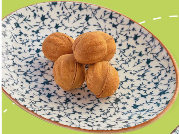
ОРЕШКИ СО СГУЩЕННОЙ