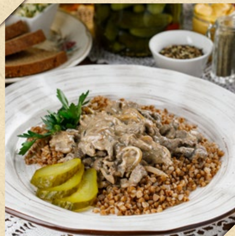
СТРОГАНОВ С ГРЕЧЕЙ

PIKE PERCH POLISH STYLE WITH MASHED POTATOES