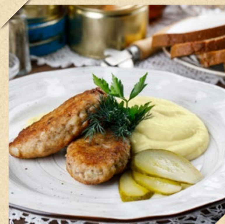
ДОМАШНИЕ КОТЛЕТЫ С КАРТОФЕЛЬНЫМ ПЮРЕ

Мясо, лук и чеснок пропустить через мясорубку Добавить яйцо, соль и перец перемешать. Сформировать фарш картона отбиты (25-30 раз). Добавить воду, перемешать. Сформировать котлеты, обвалять на растительном масле в растительном масле.