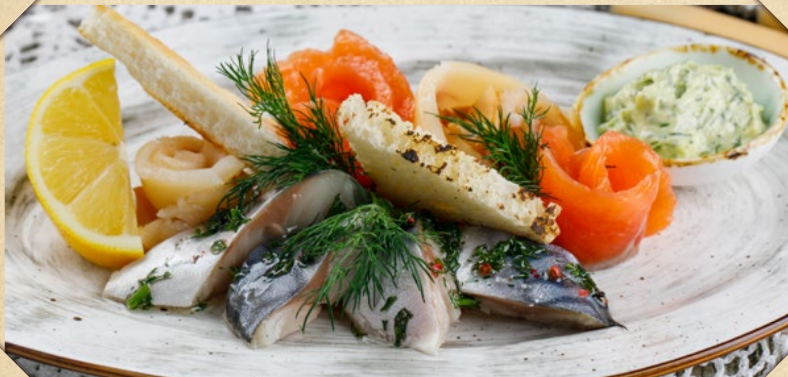
РЫБНОЕ АССОРТИ 980р. скумбрия пряного посола, масляная рыба, лосось слабой соли FISH PLATE spiced-salted mackerel, dollar fish, mild-cured salmon