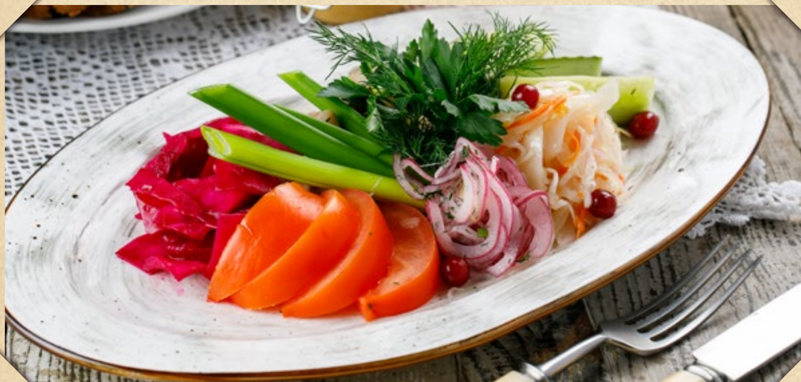
ДОМАШНИЕ СОЛЕНЬЯ огурцы соленые, капуста квашеная, капуста по-грузински, помидоры малосольные, чеснок маринованный