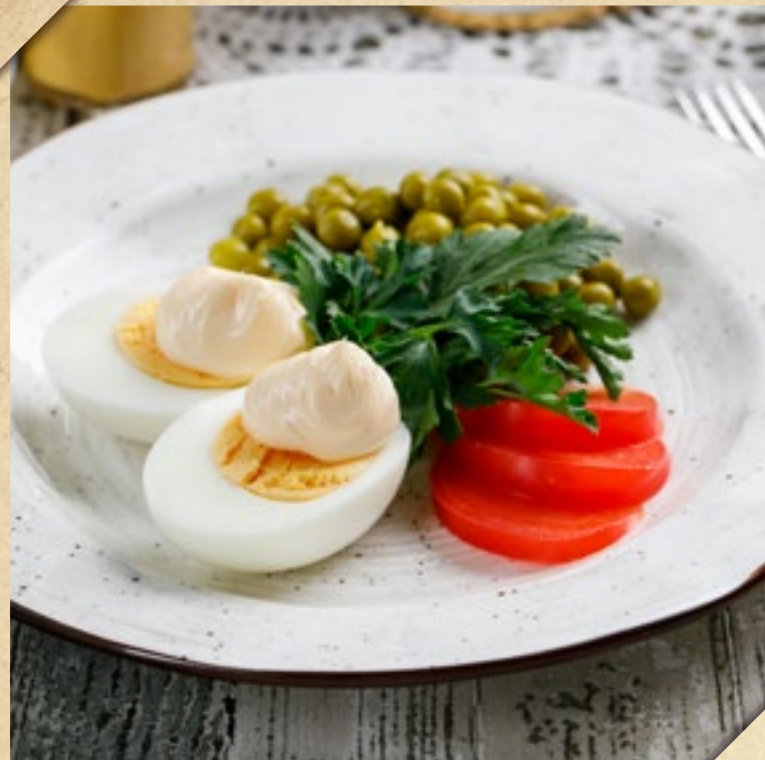
ЯЙЦО ПОД МАЙОНЕЗОМ С ЗЕЛЁНЫМ ГОРОШКОМ