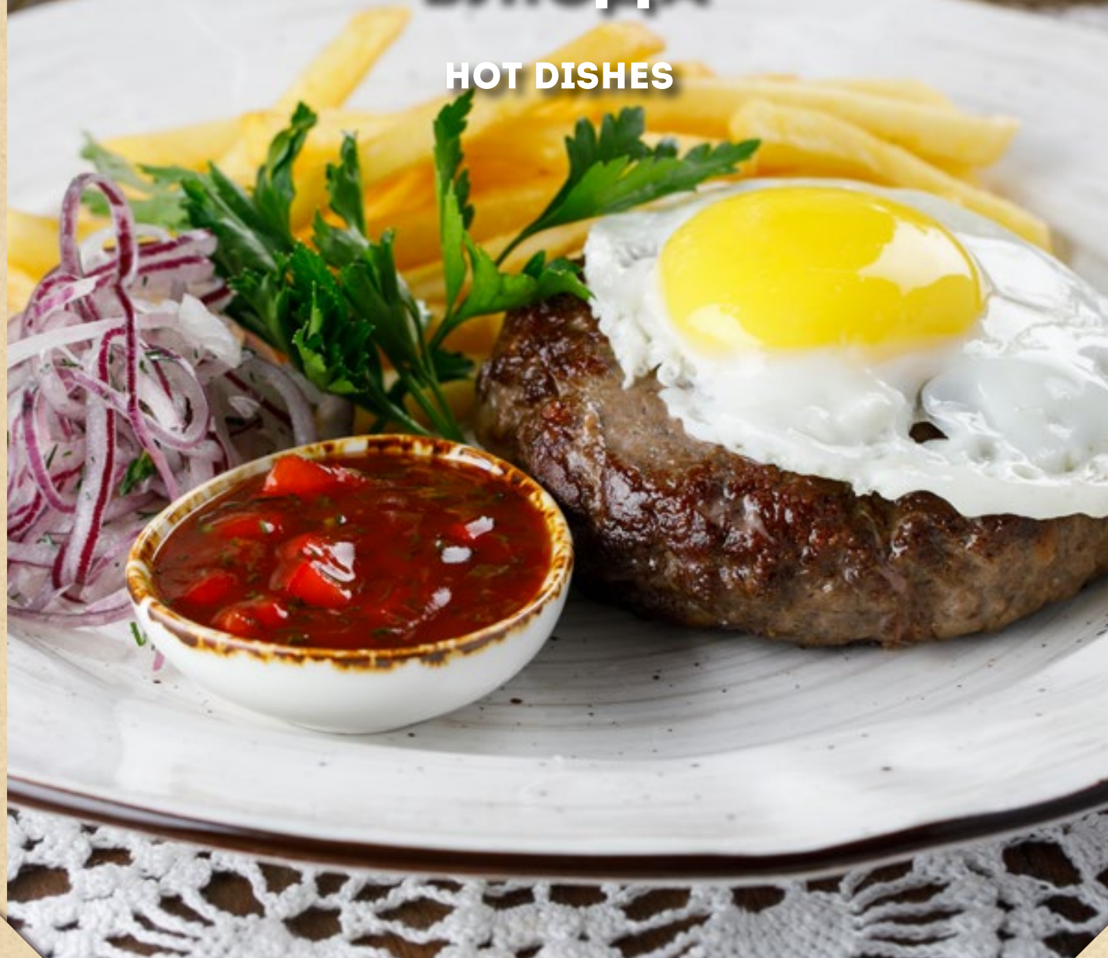
РУБЛЕННЫЙ БИФШТЕКС С ЯЙЦОМ И КАРТОФЕЛЕМ ФРИ