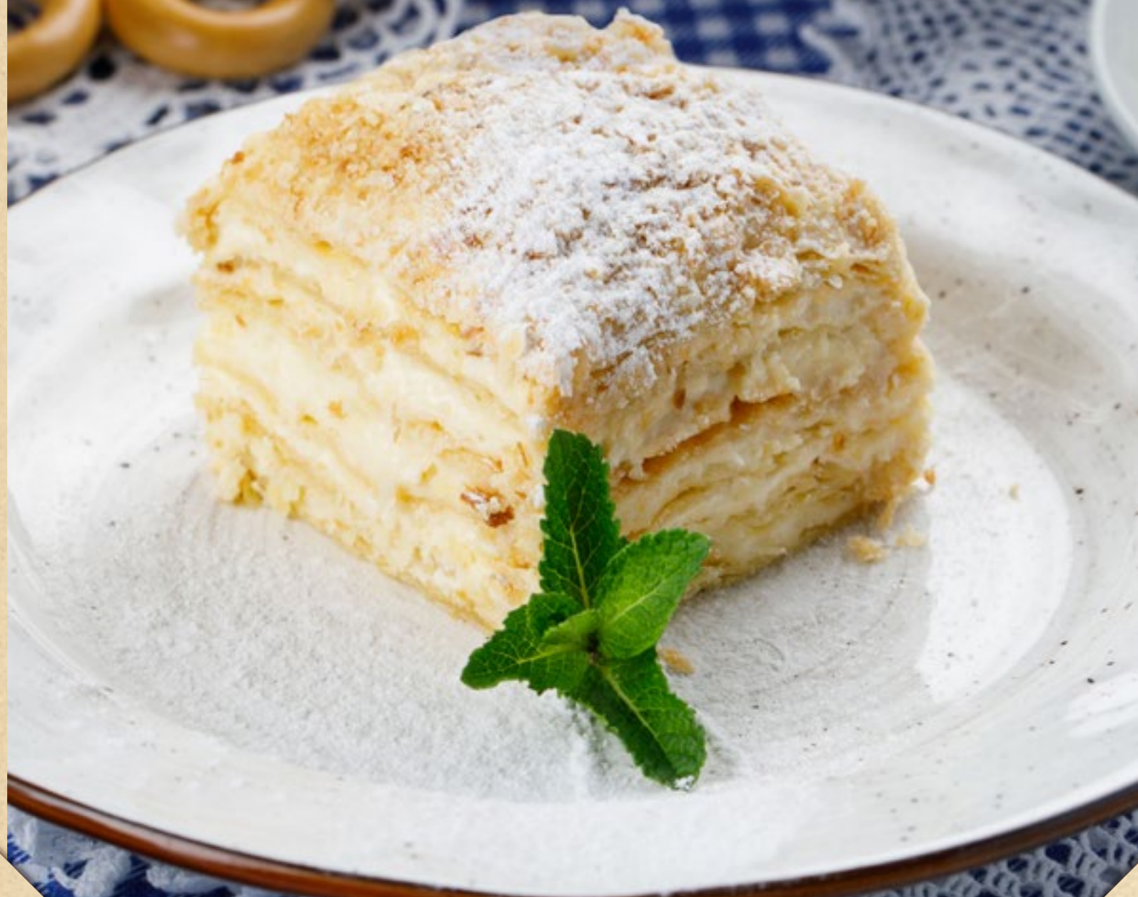
ДОМАШНИЙ НАПОЛЕОН С ЗАВАРНЫМ КРЕМОМ