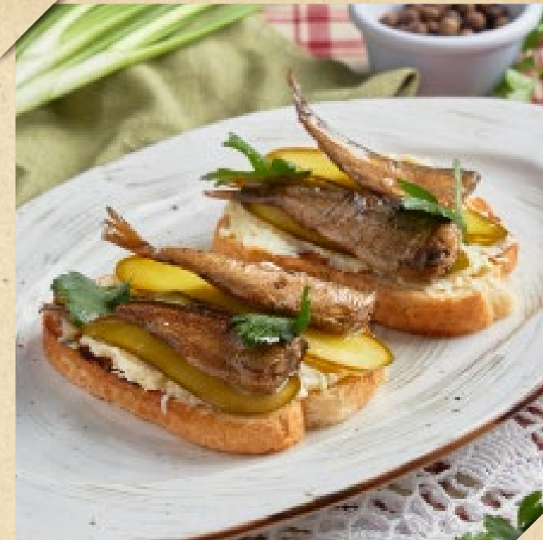
БУТЕРБРОД СО ШПРОТАМИ