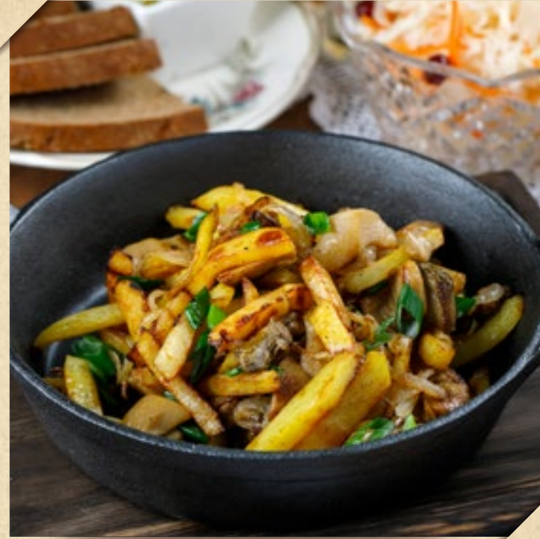
КАРТОФЕЛЬ, ЖАРЕНЬИ С ГРИБАМИ

SALMON FILLET BRAISED IN CREAM SAUCE WITH POTATOES AND LEEKS