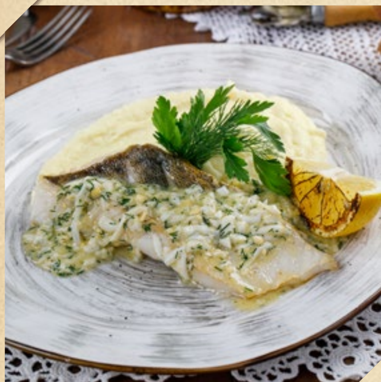
СУДАК ПО-ПОЛЬСКИ С КАРТОФЕЛЬНЫМ ПЮРЕ