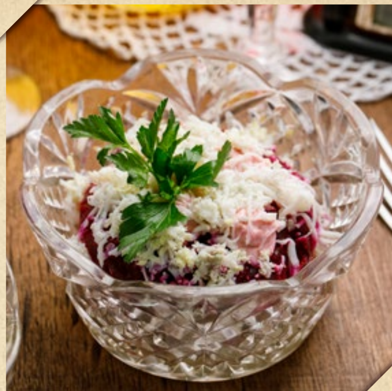
СЕЛЬДЬ ПОД ШУБОЙ

В соус желтки добавить горчицу и соль. Варить 5 минут. Добавить растительное масло. При непрерывном взбивании вливать по 1 ст. ложке растительного масла, чтобы постепенно сметался сырочек. Добавить уксус и сахар. Плотно накрыть крышкой и остудить.