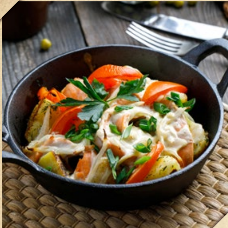
ФИЛЕ ЛОСОСЯ В СЛИВОЧНОМ СОУСЕ С КАРТОФЕЛЕМ И ЛУКОМ-ПОРЕЕМ