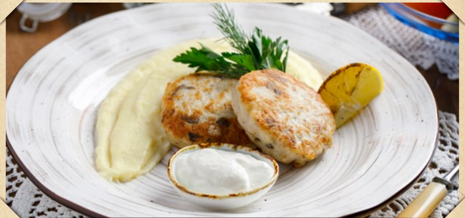
ЩУЧЬИ КОТЛЕТЫ С КАРТОФЕЛЬНЫМ ПЮРЕ

POZHARSKY CUTLET WITH MASHED POTATOES AND BASIL