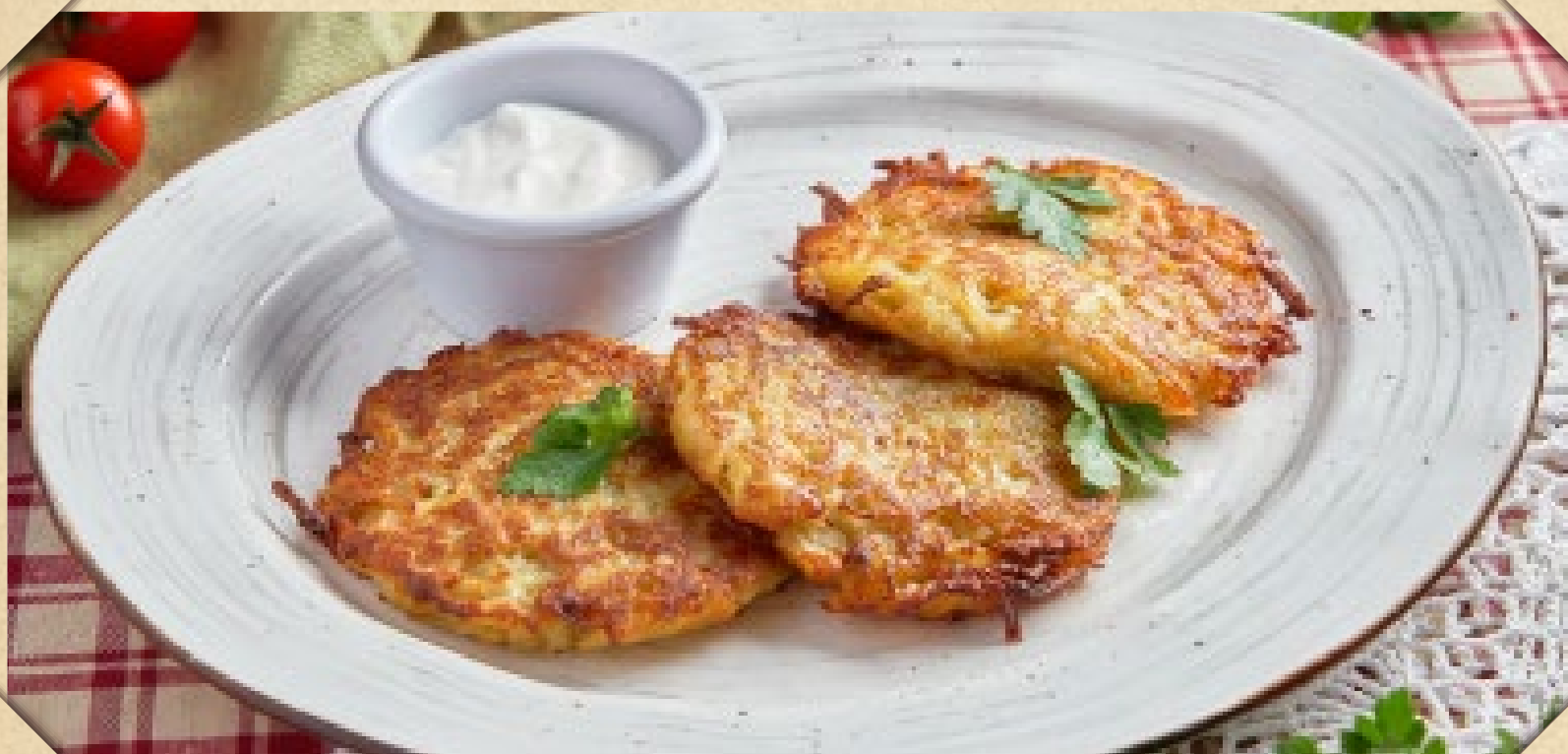
ДРАНИКИ СО СМЕТАНОЙ