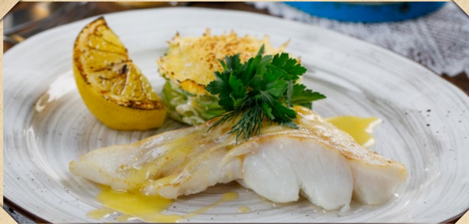
ЖАРЕНАЯ ТРЕСКА С ГРАТЕНОМ ИЗ ЦУКИНИ