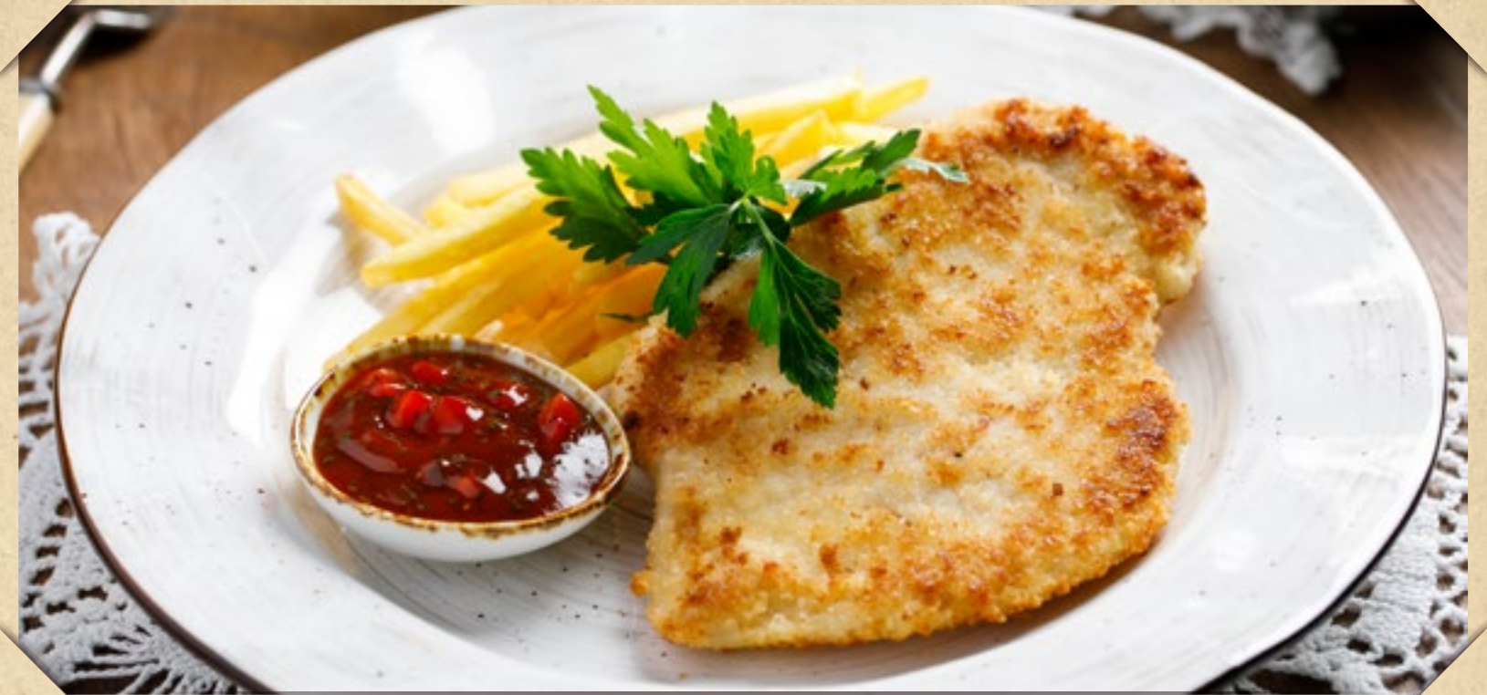
КУРИНЫЙ ШНИЦЕЛЬ ПО-МИНИСТЕРСКИ С КАРТОФЕЛЕМ ФРИ