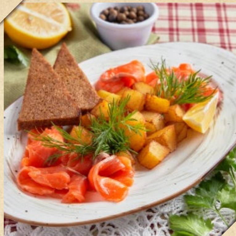
ЛОСОСЬ СЛАБОЙ СОЛИ 790р. С ОТВАРНЫМ КАРТОФЕЛЕМ MILD-CURED SALMON WITH BOILED POTATOES