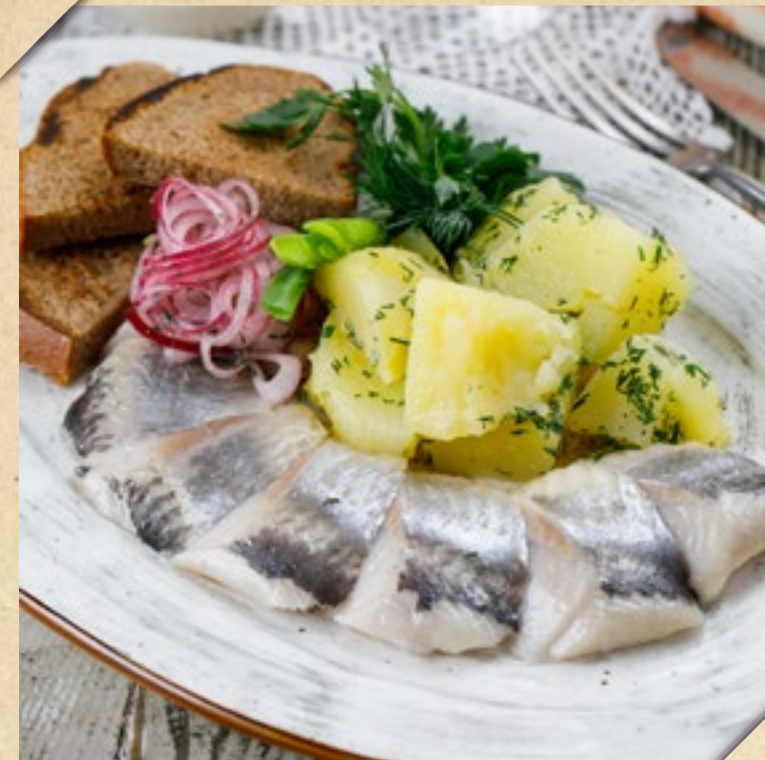
СЕЛЬДЬ АТЛАНТИЧЕСКАЯ С ОТВАРНЫМ КАРТОФЕЛЕМ

HERRING VORSCHMACK, SERVED WITH TOASTED RYE BREAD