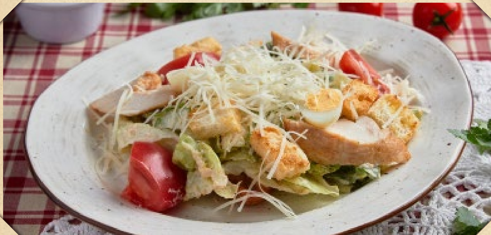
ЦЕЗАРЬ С ЦЫПЛЁНКОМ

GEORGIAN SALAD WITH VEGETABLES AND FRIED CIRCASSIAN CHEESE