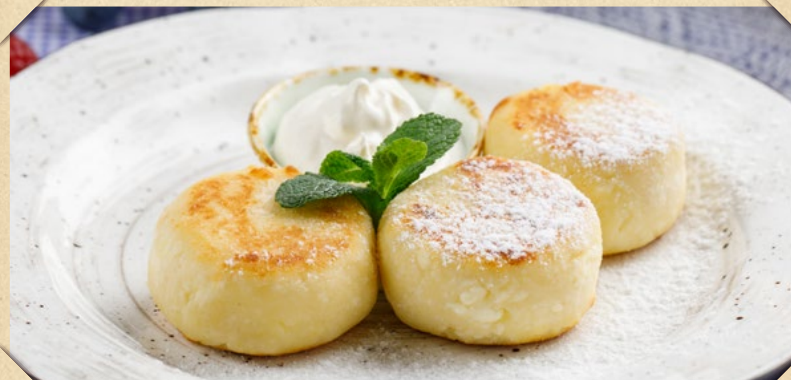
СЫРНИКИ СО СМЕТАНОЙ, ВАРЕНЬЕМ, СГУЩЁННЫМ МОЛОКОМ ИЛИ МЁДОМ, НА ВЫБОР 450р.

UKRAINIAN COTTAGE CHEESE PANCAKES WITH SOUR CREAM, JAM, CONDENSED MILK OR HONEY