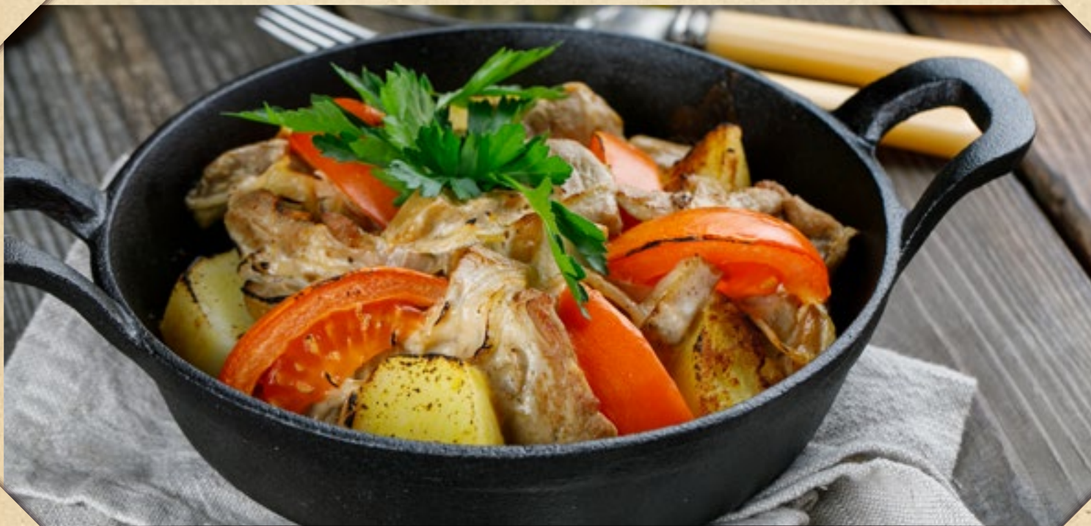
СВИНИНА, ЗАПЕЧЁННАЯ С КАРТОФЕЛЕМ, ТОМАТАМИ И ГРИБАМИ