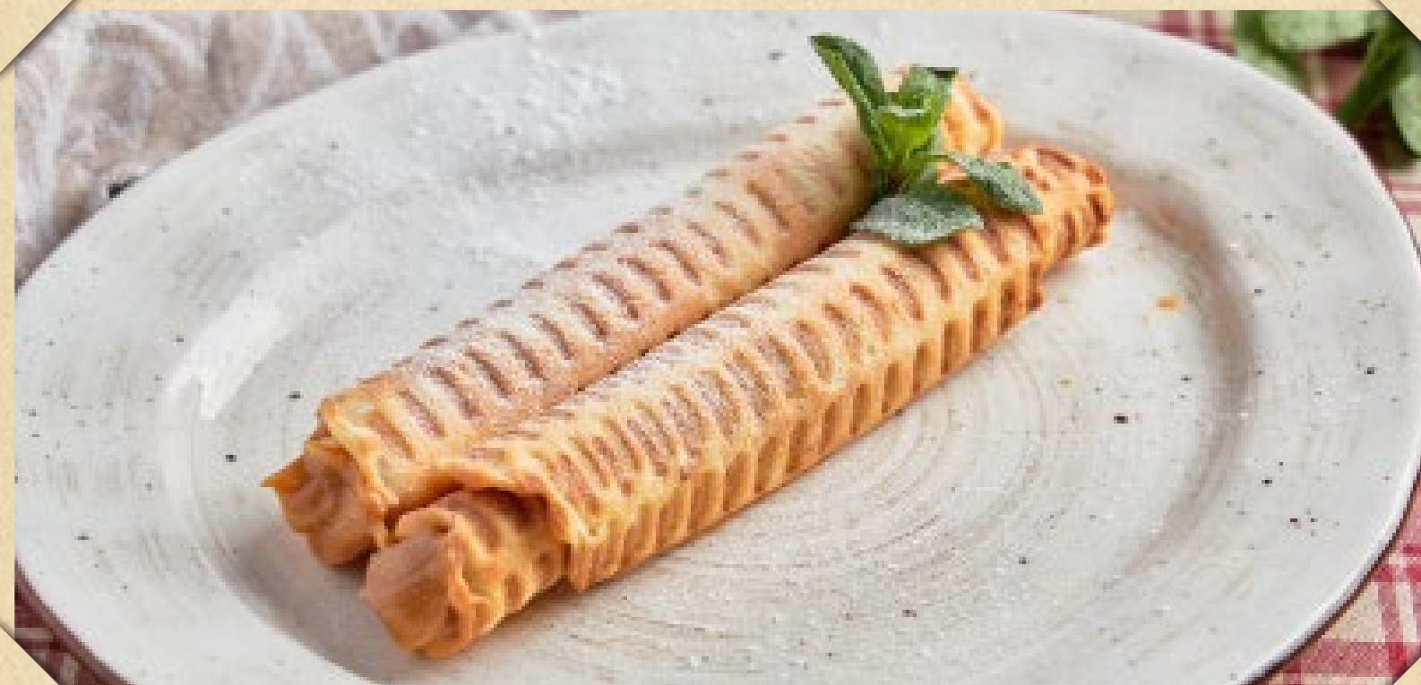
ВАФЕЛЬНЫЕ ТРУБОЧКИ С ВАРЕНОЙ СГУЩЕНКОЙ

ICE CREAM vanilla, chocolate, strawberry