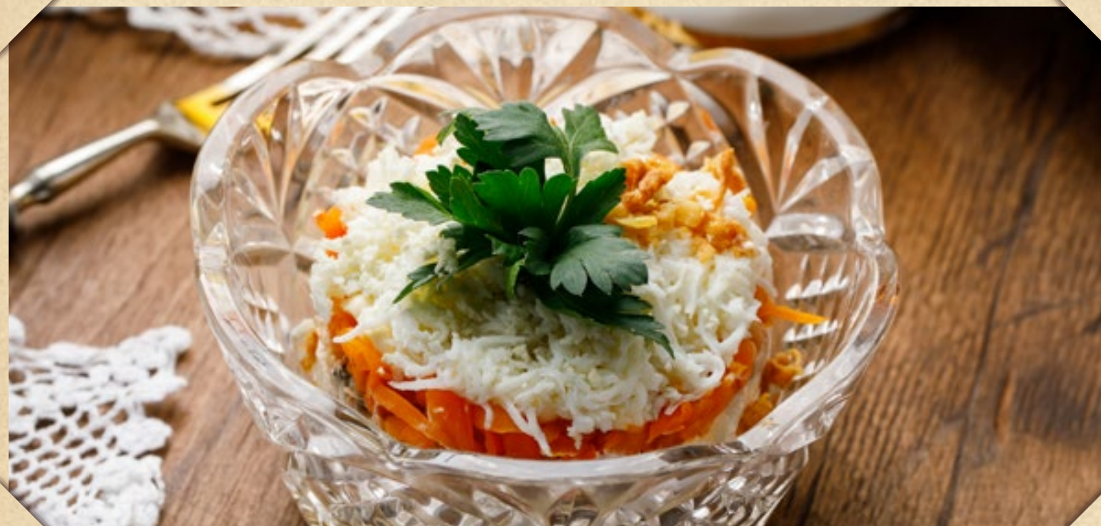
МИМОЗА С ЛОСОСЕМ