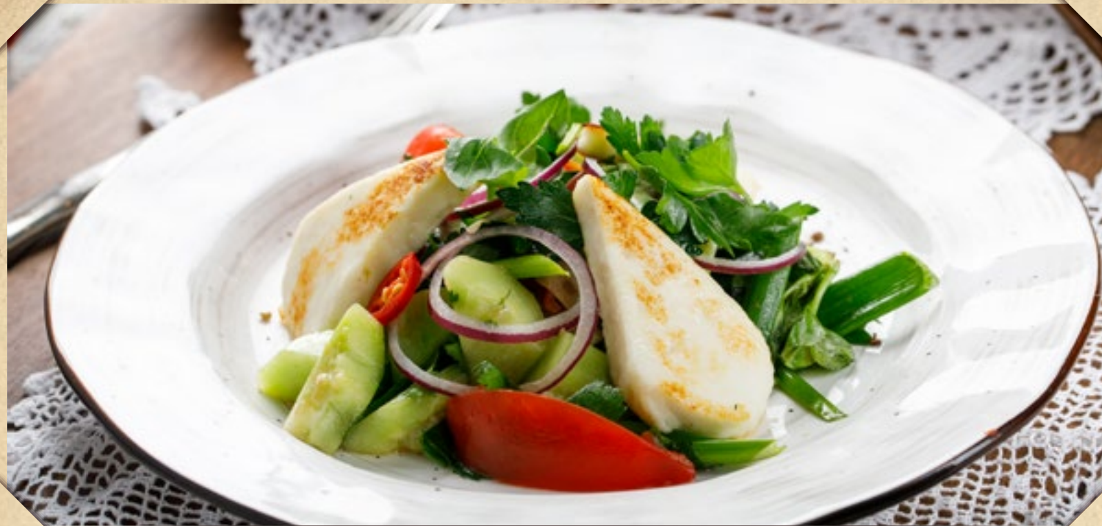
ГРУЗИНСКИЙ САЛАТ С ОВОЩАМИ И ЖАРЕНЫМ АДЫГЕЙСКИМ СЫРОМ