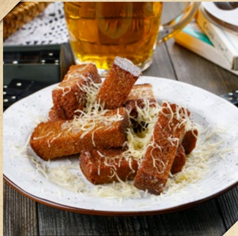
ГРЕНКИ С СЫРОМ И ЧЕСНОКОМ