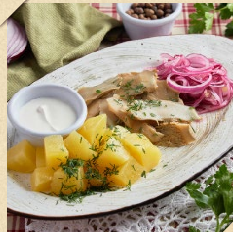
СОЛЕННЫЕ ГРУЗДИ С МАРИНОВАННЫМ ЛУКОМ И ОТВАРНЫМ КАРТОФЕЛЕМ

HOMEMADE SALO PLATE: PICKLED, SMOKED, RUBBED WITH RED PEPPER