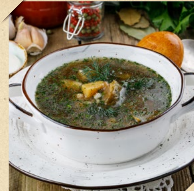
СУП ИЗ БЕЛЫХ ГРИБОВ, ПОДАЁТСЯ С ПИРОЖКОМ