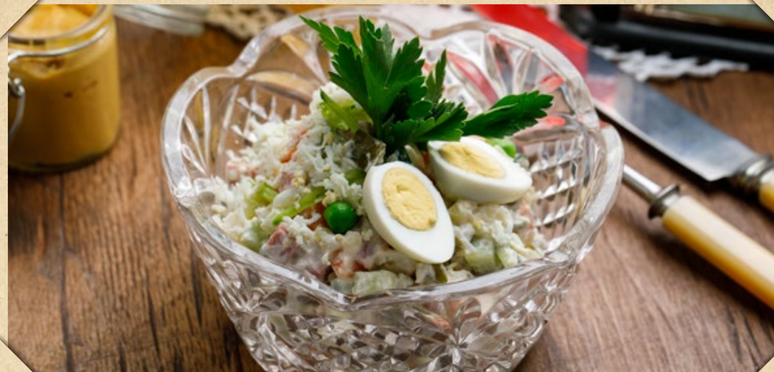
ОЛИВЬЕ С ДОКТОРСКОЙ КОЛБАСОЙ