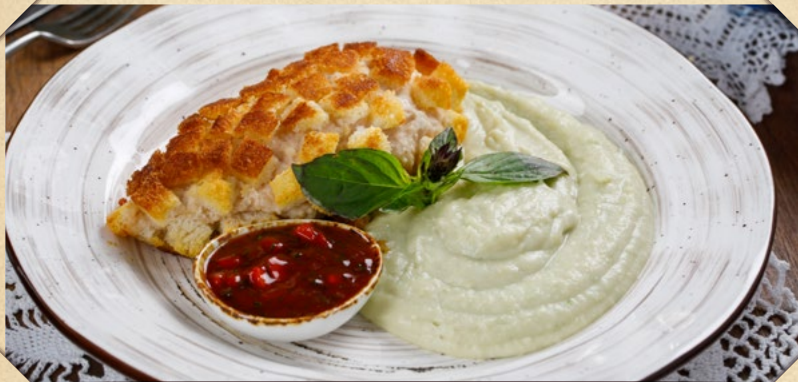
КОТЛЕТА ПОЖАРСКАЯ С КАРТОФЕЛЬНЫМ ПЮРЕ И БАЗИЛИКОМ

CHICKEN SCHNITZEL IN A MINISTERIAL WITH FRENCH FRIES