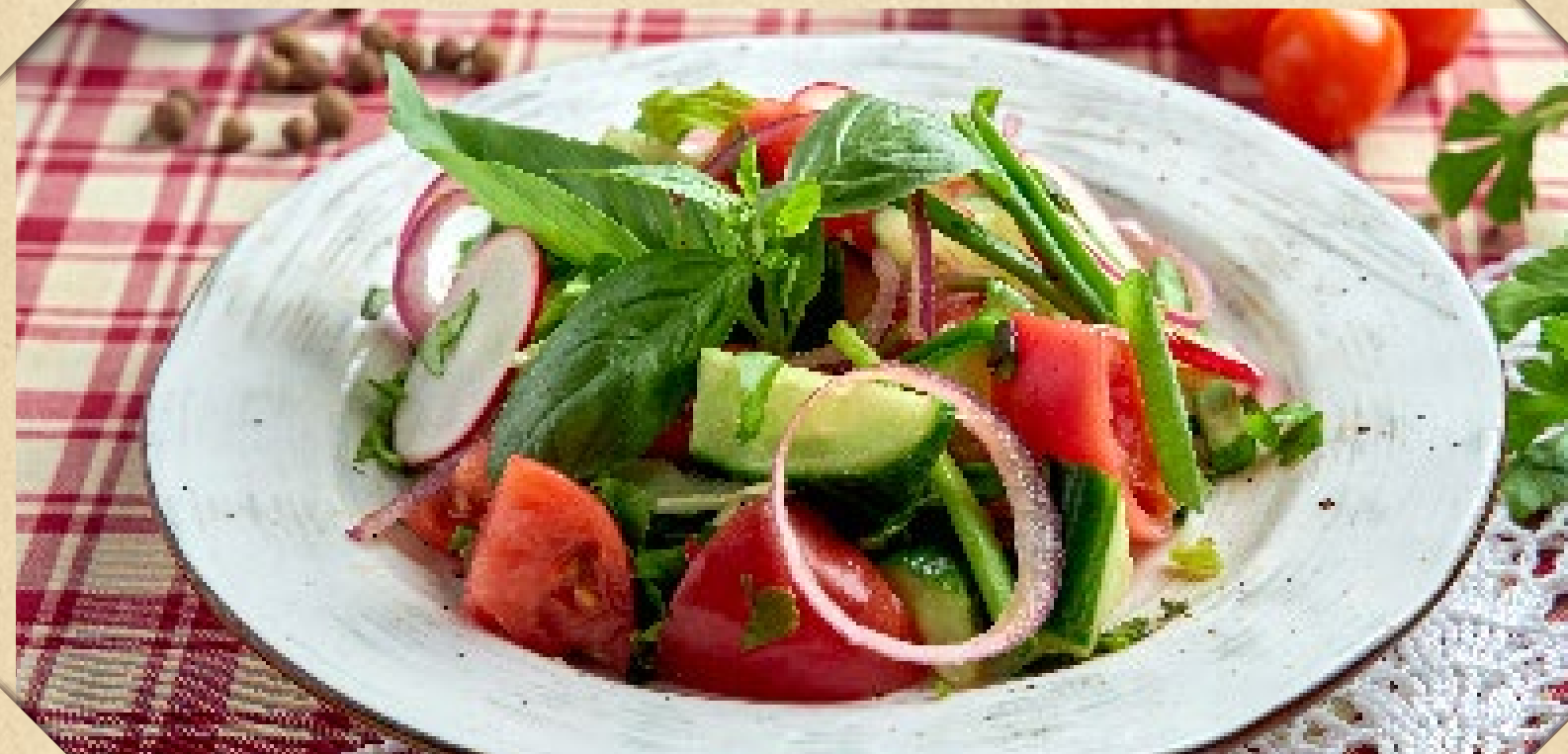
ДАЧНЫЙ САЛАТ ИЗ СВЕЖИХ ОВОЩЕЙ С ПОДСОЛНЕЧНЫМ МАСЛОМ ИЛИ СМЕТАНОЙ

DACHA SALAD : FRESH VEGETABLES AND SUNFLOWER OIL OR SOUR CREAM