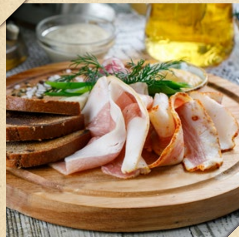
ДОМАШНЕЕ САЛО: СОЛЁНОЕ, КОПЧЁНОЕ И С КРАСНЫМ ПЕРЦЕМ

HOMEMADE PICKLES pickles, sauerkraut, Georgian cabbage, mild-cured tomatoes, brined garlic