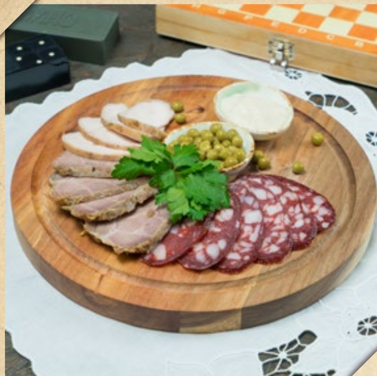
МЯСНОЕ АССОРТИ 750р. колбаса сырокопчёная, копчёная куриная грудка, буженина MEAT PLATE raw smoked sausage, smoked chicken breast, pork roast