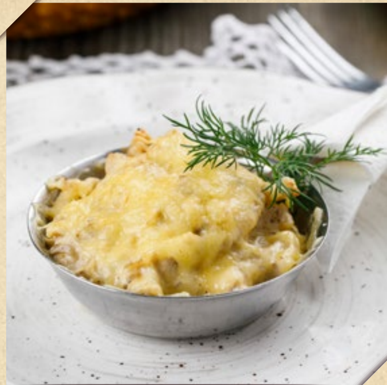
ЖЮЛЬЕН С КУРИЦЕЙ И ГРИБАМИ