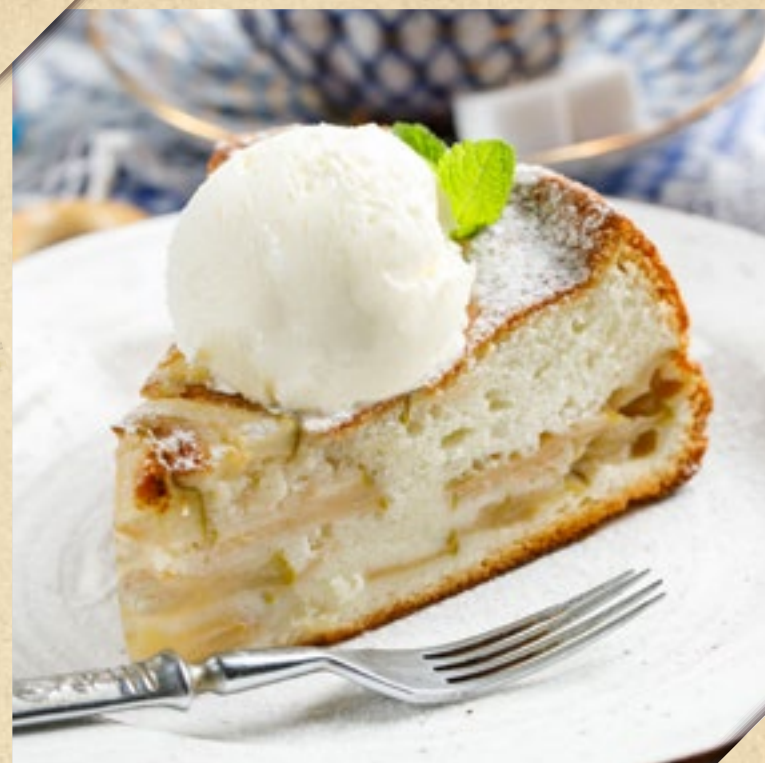
ШАРЛОТКА С ШАРИКОМ ВАНИЛЬНОГО МОРОЖЕНОГО 450р.

Для украшения яйца взбить миксером вместе с сахаром. Добавить просеянную муку выбавить ещё 1-2 минуты. Добавить сахар по желанию укрепить. Яблока нарезать саломатками, выложить в форму и залить тестом. Выпекать при 180 градусах 30-35 минут.