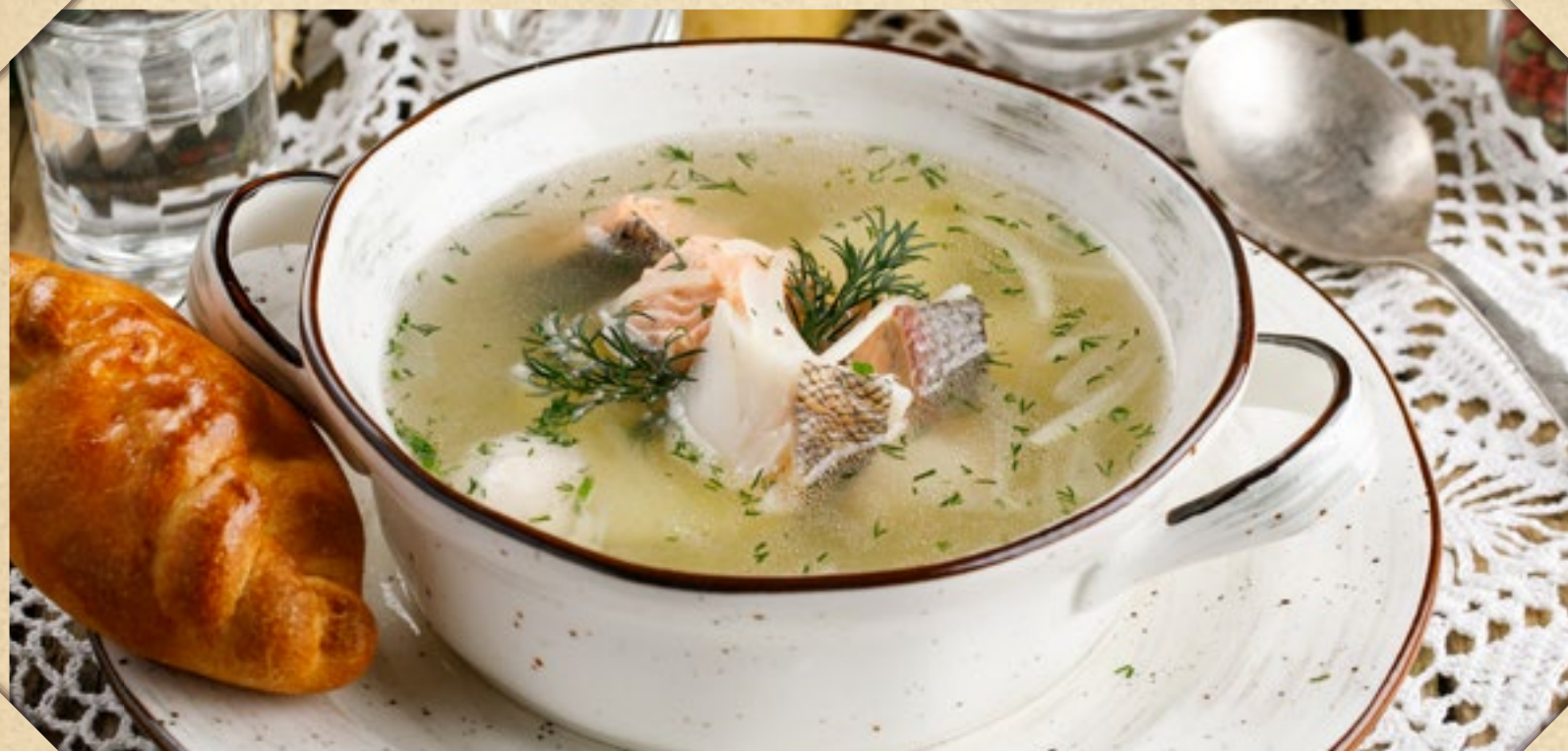
УХА, ПОДАЁТСЯ С РАССТЕГАЕМ

PORCINI MUSHROOM SOUP, WITH PIROZHOK PIE