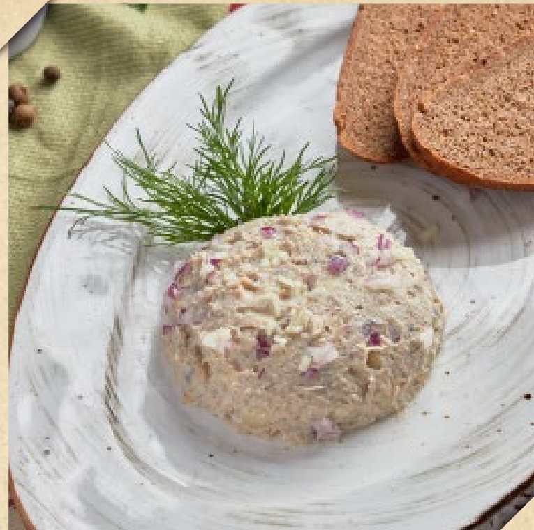
ФОРШМАК ИЗ СЕЛЬДИ, ПОДАЁТСЯ С РЖАНЬМИ ТОСТАМИ