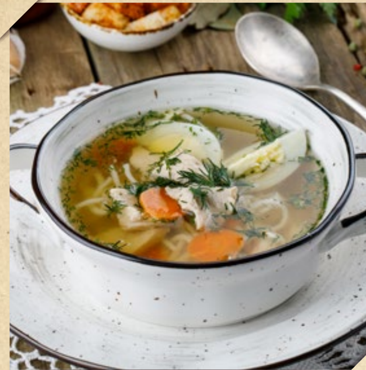
ДОМАШНИЙ СУП-ЛАПША С КУРИЦЕЙ

BORSCH WITH BEEF, SERVED WITH TOASTS, SALO AND SOUR CREAM