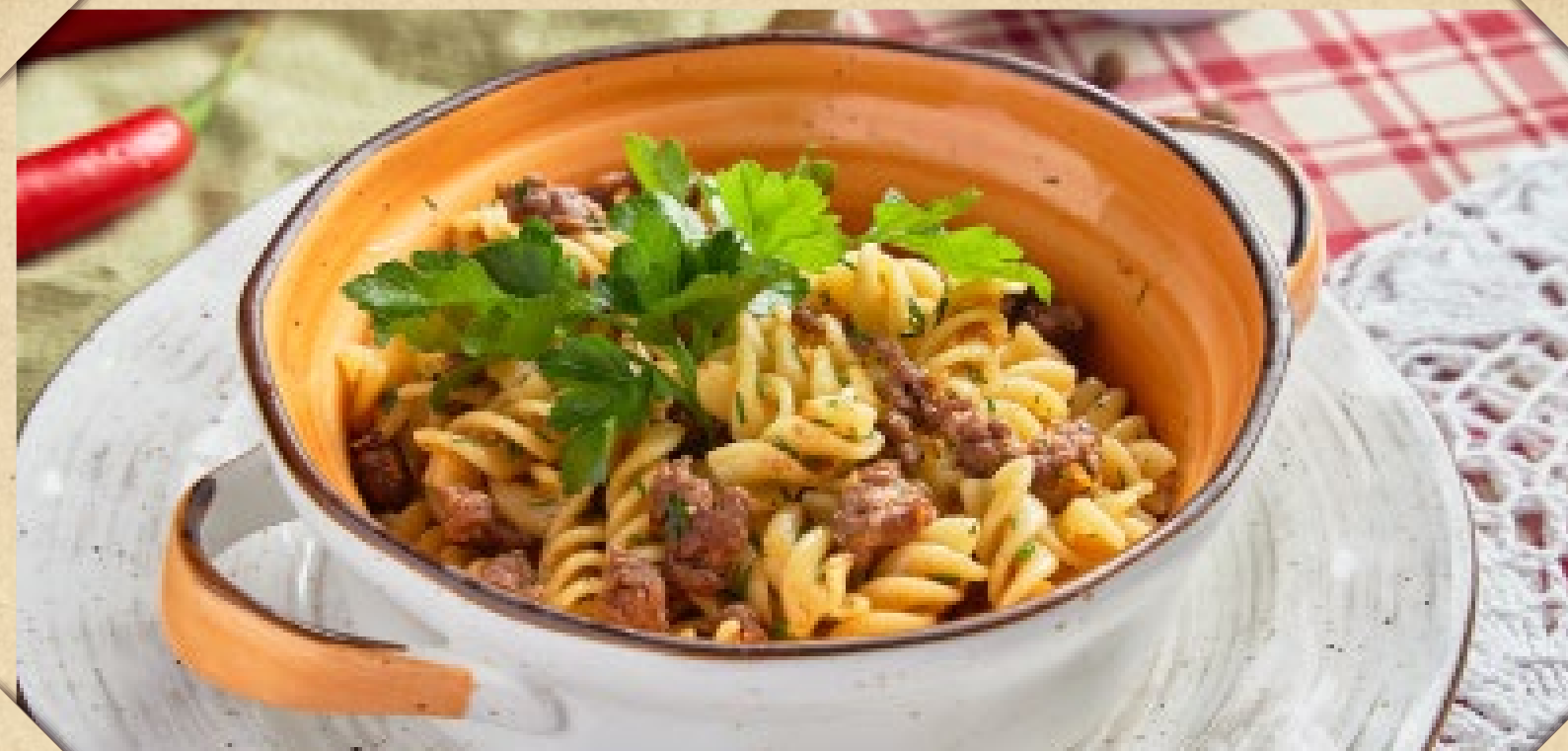
МАКАРОНЫ ПО-ФЛОТСКИ С РУБЛЕННЫМ ФАРШЕМ ИЗ МРАМОРНОЙ ГОВЯДИНЫ

RUSSIAN NAVY STYLE MACARONI WITH MINCED MARBLED BEEF