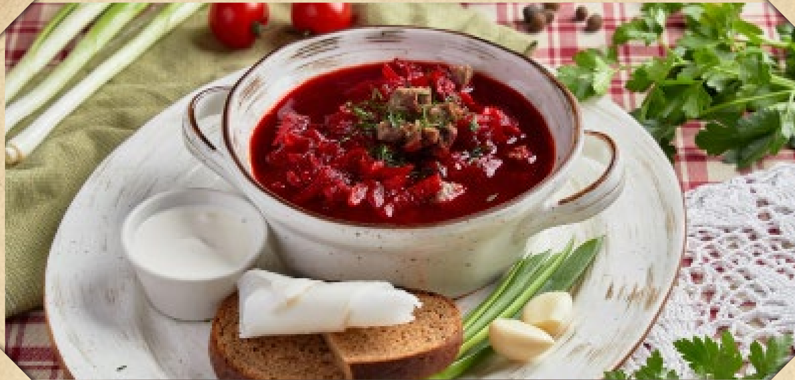
БОРЩ С ГОВЯДИНОЙ, ПОДАЁТСЯ С ГРЕНКАМИ, САЛОМ И СМЕТАНОЙ