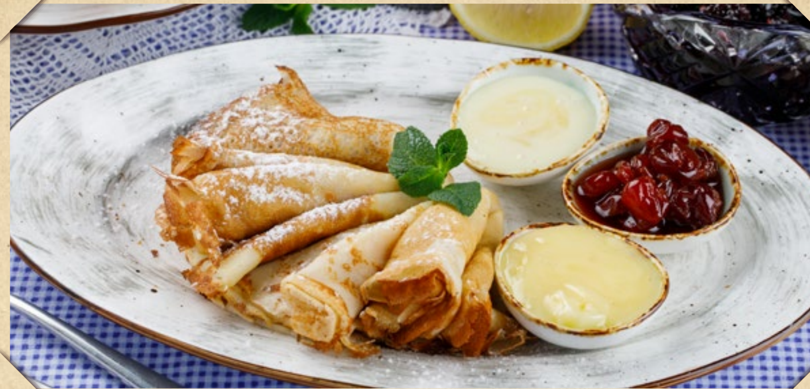
БАБУШКИНЫ БЛИНЫ СО СМЕТАНОЙ, ВАРЕНЬЕМ, СГУЩЁННЫМ МОЛОКОМ ИЛИ МЁДОМ, НА ВЫБОР (3 ШТ.) 380р.

APPLE PIE AND A BALL OF VANILLA ICE CREAM