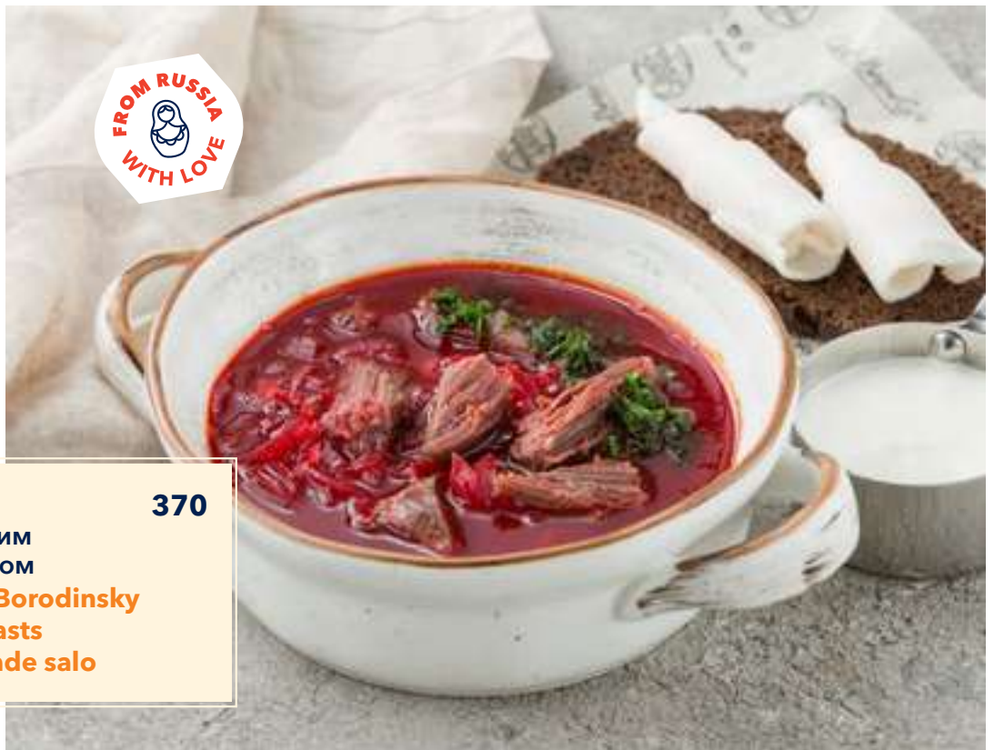
Борщ 370 с бородинским тостом и салом Borsch with Borodinsky rye bread toasts and homemade salo