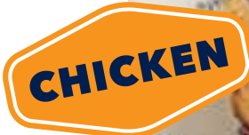
Жареный цыпленок с домашней аджикой 620 Fried chicken with homemade adjika