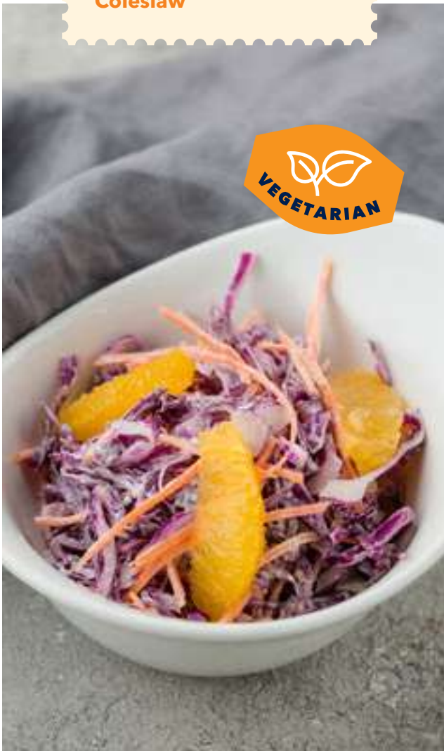
Коул слоу 190 Coleslaw