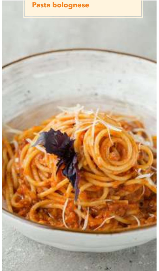
Паста болоньезе 490 Pasta bolognese