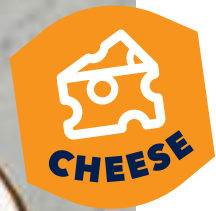
Паста 4 сыра 440 4 cheese pasta