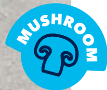
Грибной крем-суп 320 Mushroom cream soup