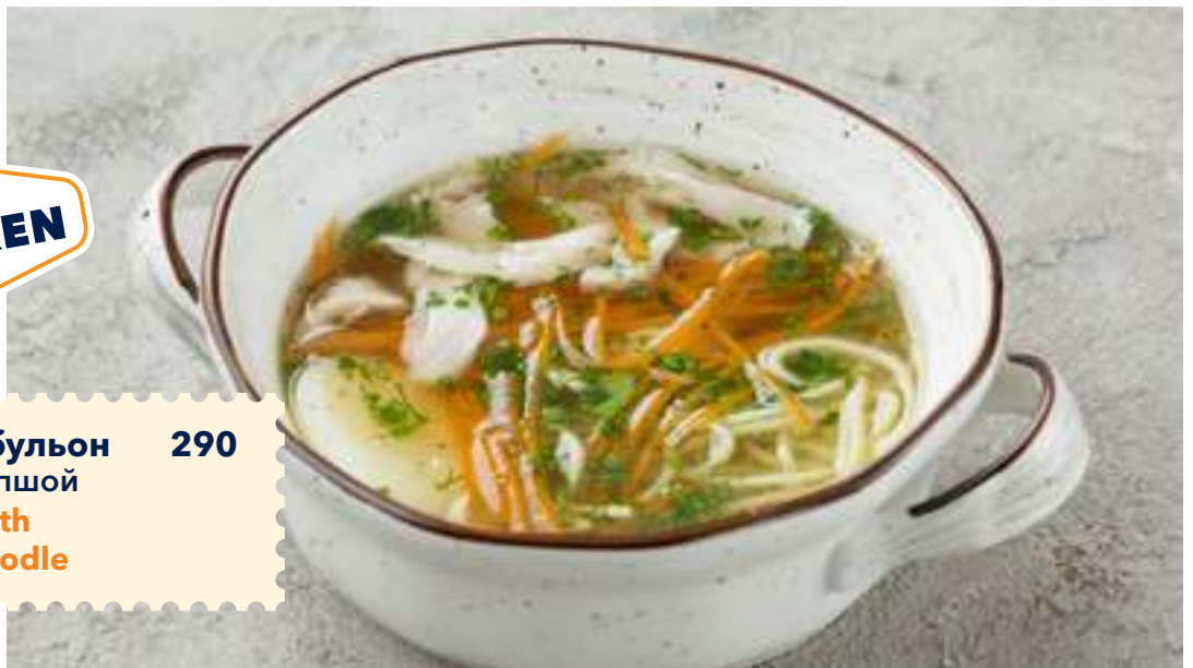
Куриный бульон 290 с яичной лапшой Chicken broth with egg noodle