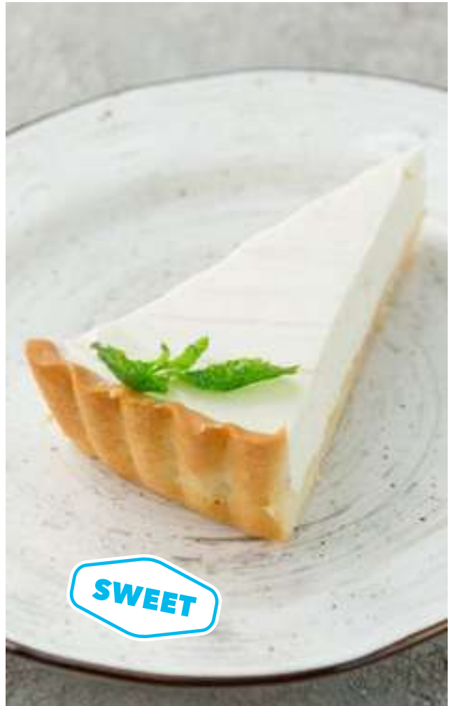
Домашний чизкейк 250 Homemade cheesecake