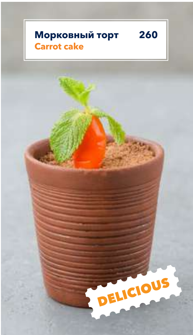
Морковный торт 260 Carrot cake