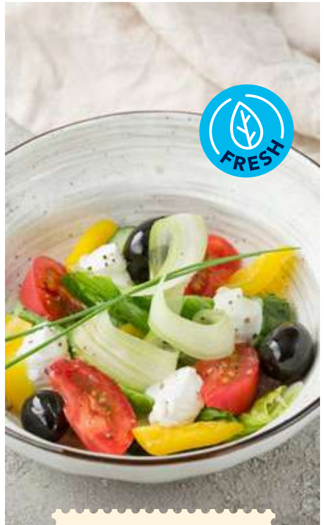
Греческий салат 390 Greek salad