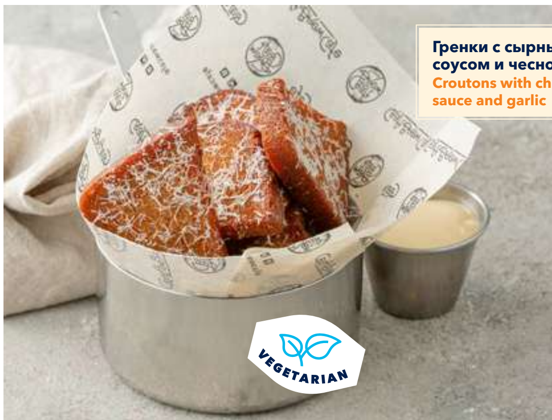
Гренки с сырным 350 соусом и чесноком Croutons with cheese sauce and garlic