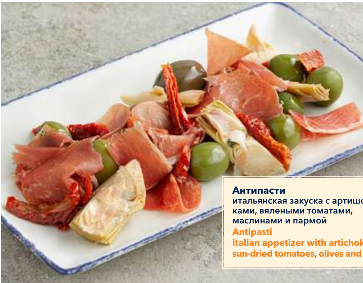
Антипаста 690 итальянская закуска с артишоками, вялеными томатами, маслинами и пармой Antipasti italian appetizer with artichokes, sun-dried tomatoes, olives and parma