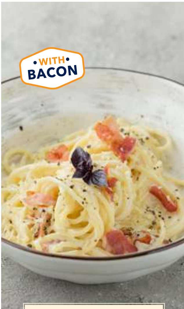
Паста карбонара 450 Pasta carbonara